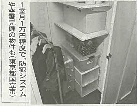
1室月1万円程度で、防犯システムや空調完備の物件も(東京都国立市)

ており契約には至らなかったが「物件があればすぐ買いたい」という相談は個人・法人ともに多い(高野社長)という。トランクルーム大手のエアリンクは昨年、投資家への物件売却や土地